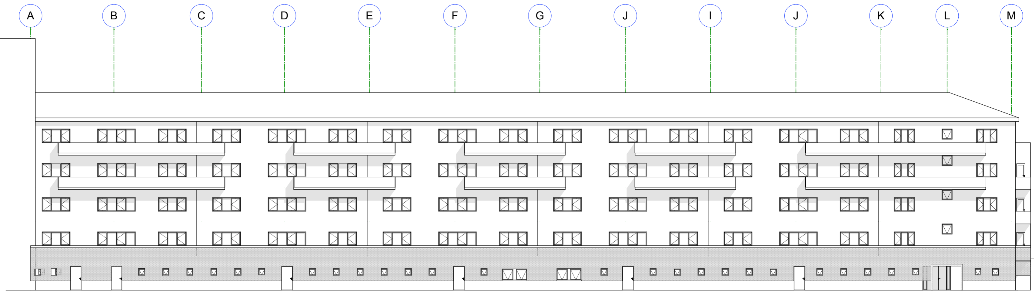
Sør Fasade 1:200