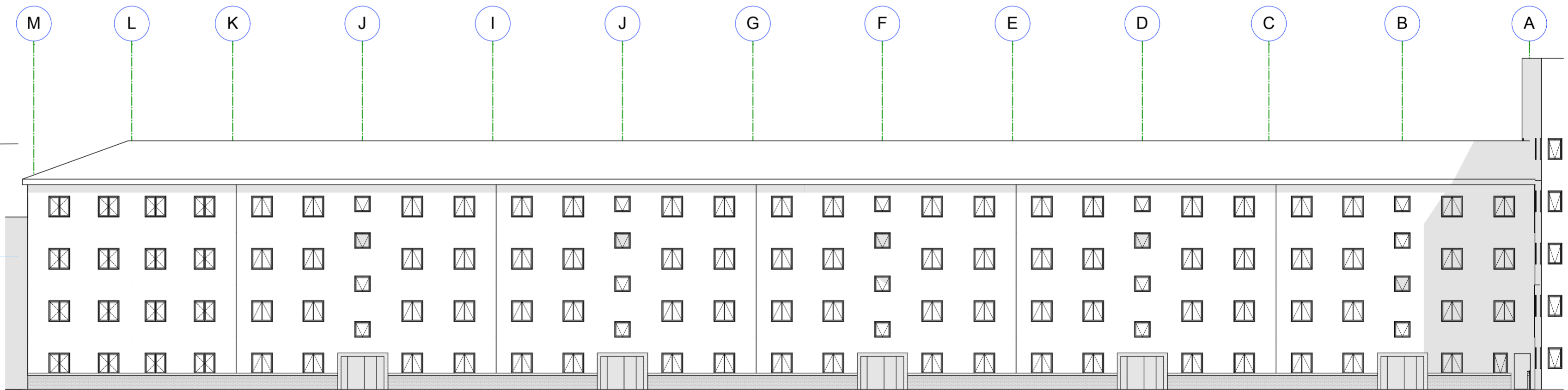
Nord Fasade 1:200